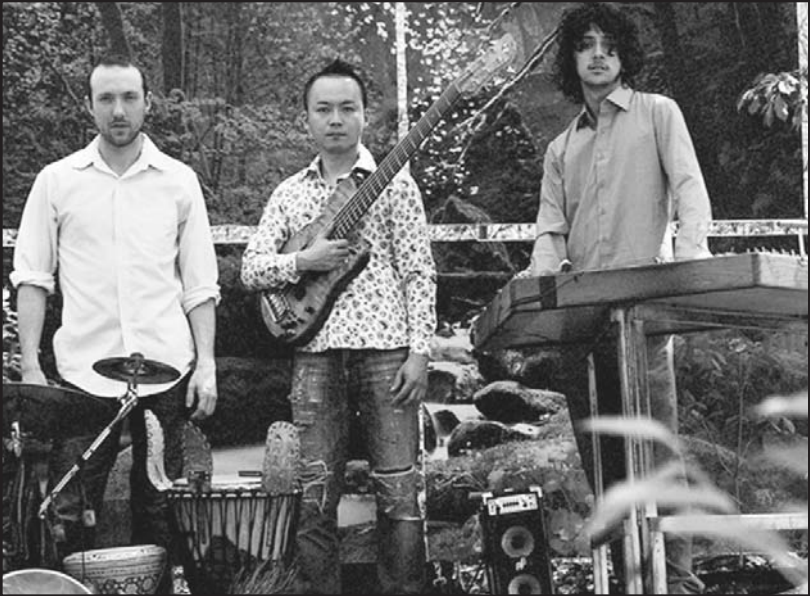
Grupo House Of Waters.

Clark, NJ- El Johnny K's restaurant, un establecimiento de esta ciudad localizado en el número 1030 de Raritan Road, el pasado 27 de marzo fue la sede de un concierto de Jazz a cargo del grupo House Of Waters.